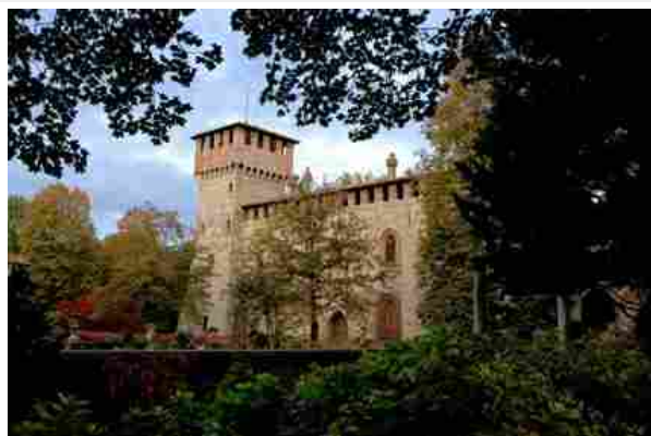
Il castello di Grazzano Visconti (Pc), che ospiterà Verde Grazzano

contribuisce di certo al fascino della rassegna: infatti, il suo stile eclettico offre un susseguirsi di scorci che, pur se appartenenti a tempi e influenze differenti, convivono armoniosamente: le simmetrie del giardino all'italiana, il romanticismo di boschi e profumati roseti, l'esotismo di macchie di bambù, il barocco di statue e fontane. Partecipano a questa prima edizione 40 espositori (di cui la metà vivaisti produttori) e sono previsti 5mila visitatori. Biglietto d'ingresso a 10 euro.