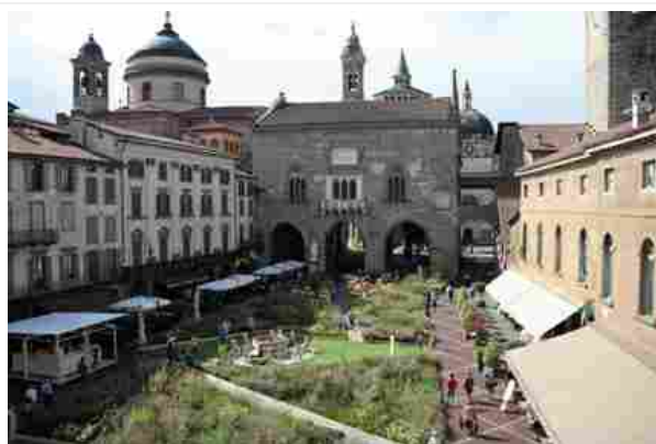
IMDP 2018, a Bergamo Alta, la Piazza Vecchia trasformata in Green Square da Piet Oudolf

Com'è ormai quasi palpabile, l'interesse verso l'orticoltura, il design outdoor e l'architettura del paesaggio è sempre più sviluppato e popolare anche in Italia, che non ha esattamente – come, invece, l'Inghilterra – lo spirito green nel sangue. Ma, per fortuna, ormai da qualche tempo anche da noi – e, in particolare, in Lombardia – nascono, si moltiplicano e negli anni ben si sviluppano dei cadenzati appuntamenti 'verdi', anche parecchio differenti tra loro per i segmenti trattati e per il livello dello specifico dibattito, ma comunque degni di nota per pubblici differenti, variegati e curiosi.