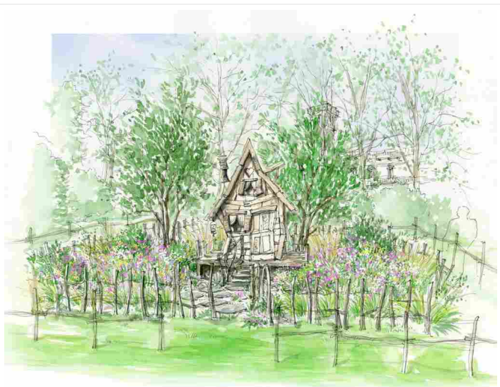
Orticolario 2018, uno degli otto progetti finalisti del concorso Spazio Creativo