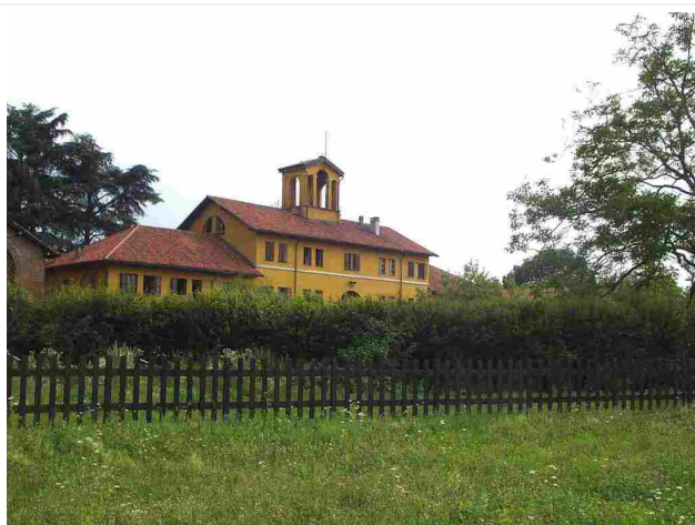
A Cascine aperte 2018, anche Cascina Frutteto della Scuola agraria del Parco di Monza

Il 29 e 30 settembre torna, alla sua nona edizione, la manifestazione Cascine Aperte ( www.associazionecascinemilano.org/evento/cascine-aperte-2018 ), organizzata dall'Associazione cascine Milano, durante la quale visitare le cascine di Milano e del Parco di Monza, inserite nel tessuto urbano cittadino o proprio sui confini, che ospitano molteplici e diversificate 'esperienze'. Sono oltre 30 le cascine partecipanti e, tra loro, ce ne sono alcune a vocazione prevalentemente agricola, sociale, culturale. Il programma della due giorni è variegato: dai più classici mercati agricoli a visite guidate a frutteti di varietà antiche, dalle passeggiate nel verde alla scoperta del patrimonio archeologico e naturalistico, dalla musica dal vivo alle incursioni teatrali. E continua la collaborazione con il Consorzio di Villa Reale e Parco di Monza , per cui saranno tre le cascine aperte, nonché la Scuola agraria del parco di Monza, con visite guidate, laboratori e mercati contadini. Ingresso gratuito.