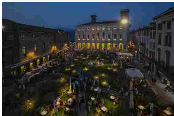
IMDP 2018, la soire?e offerta da Pedrali in Piazza Vecchia a Bergamo Alta