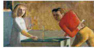
Tributo a Balthus