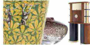
The best of design: settembre 2018