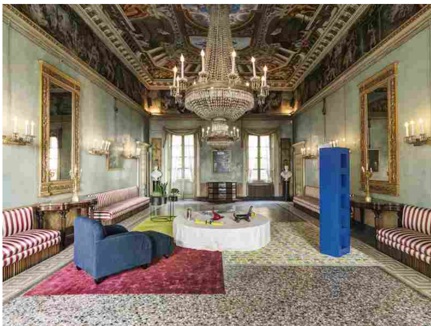
Palazzo Moroni, Aldo Cibic, DimoreDesign 2015

Con questa manifestazione, infatti, il capoluogo bergamasco svela le segrete bellezze di alcuni suoi palazzi storici che, per un mese, hanno aperto i propri ambienti accogliendo le creazioni di designer internazionalmente conosciuti che, con i loro interventi, hanno re-interpretato, sollecitato, modificato le stanze, i saloni, ma anche i giardini e gli esterni di queste prestigiose dimore.