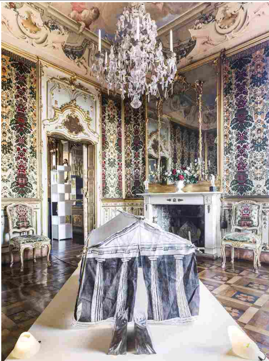
Palazzo Terzi, Franco Raggi, DimoreDesign 2015 (2015)

Gli allestimenti sono visioni creative che nella cornice in cui s'inseriscono sanno trasformare il contesto amalgamandosi con esso e mai esasperando la scenografica ricchezza stilistica che li circonda come qualcosa di alieno con cui interferire per opposizione.